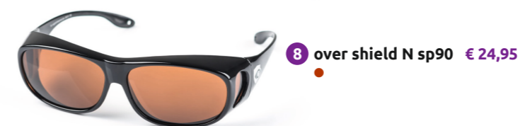
8 over shield N sp90 € 24,95 ●