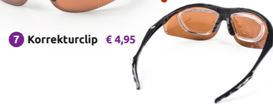
7 Korrekturclip € 4,95