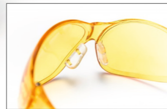
4 Ersatz-Nasenpad € 2,00