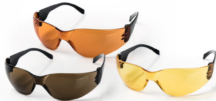
1 eye shield classic/junior € 15,95 ●●●

Als eye shield junior in schmalere Ausführung (für schmale Gesichter und Kinder ab ca. 8 Jahren) lieferbar mit den Scheiben s82 ● (Art.-Nr. 11.01), red ● (Art.-Nr. 11.06) und yellow sx ● (Art.-Nr. 11.07). € 15,95