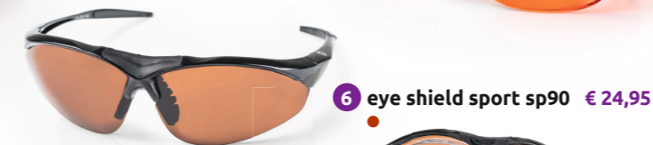
6 eye shield sport sp90 € 24,95 ●