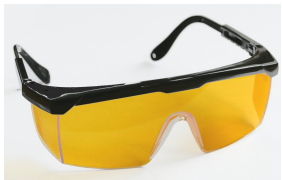
over shield VBN yellow, Art. Nr. 38.17 € 15,95

Als Nachfolgemodell unserer over shield VB yellow sx haben wir neu das Modell over shield VBN yellow im Programm. Sie ist ähnlich geformt, als Überziehbrille für Korrekturbrillen bis ca. 12 cm Breite geeignet und bietet einen sehr hohen Blauschutz. Sie ist verkehrstauglich am Tage .