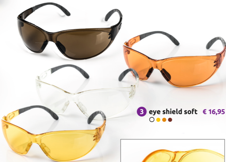
3 eye shield soft € 16,95 ○●●●

Extrabreite Überbrille, passt über Korrekturbrillen bis ca. 15 cm Breite . Panoramascheibe, breite Bügel in Scheibenfarbe. Lieferbar mit den Scheiben yellow sx ● (Art.-Nr. 09.07) und red ● (Art.-Nr. 09.06). Gewicht 44 g. € 15,95