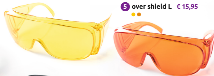
5 over shield L € 15,95 ●●

Elegante universal-Sonnenbrille, die auch als Überbrille über Korrekturbrillen (bis 13,8 cm Breite und 4,2 cm Höhe) getragen werden kann. Optimaler Rundumschutz. Mit polarisierenden solsecur®-Scheiben , dadurch Unterdrückung von Reflexionen an waagrechten Oberflächen. Scheiben rotbraun sp90 ●, lieferbar mit der Rahmenfarbe Dunkelblau (Art. Nr. 27.31) oder Schwarz, siehe Abbildung (Art. Nr. 28.31). € 24,95