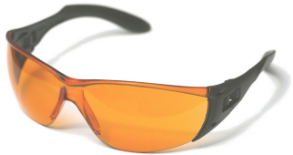
Preis jeweils € 15,95

Leider werden folgende Brillen aus unserem Programm nicht mehr hergestellt und wir können nur noch restliche Lagerbestände verkaufen: eye shield soft s 82 (Nr. 02.01)* , over shield L red und yellow sx* (Nr. 09.06 und 09.07*) und eye shield junior s82*, yellow sx und red (Nr 11.0x) . Ob jeweils noch Restbestände verfügbar sind, können Sie im Webshop sehen oder telefonisch erfragen (* = ausverkauft). Eye shield classic in braun ist in fast baugleicher Version ab sofort wieder verfügbar als eye shield classic s86 (Nr. 01.11) ; eye shield classic red wurde durch die sehr ähnliche eye shield cn red ersetzt (Nr. 31.06).